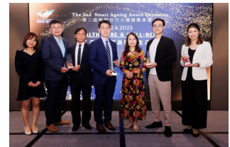
康健服務及優質生活

為推動智齡城市在亞洲的發展，本會舉辦第二屆智齡世代大獎 (2022)，旨在表彰為黃金一代帶來優質、享有獨立和有尊嚴的生活的傑出服務、產品及計劃，藉此促進創新的理念和行動，重塑未來智齡城市。是次比賽收到50多份參賽方案，而當中共有16隊隊伍脫穎而出，競逐四大獎項。入選隊伍更獲安排到房協長者安居資源中心的「智友善」家居探知館和香港理工大學的「賽馬會智齡匯」體驗中心參觀。其後，亦為他們舉行的啟發研討會，邀請著名發展商協成行和智齡專家，跟過百位入圍隊伍代表就智齡科技的應用和發展進行分享，親授經驗和心得。經過最終評審，最終在2023年8月「黃金盛宴」中頒發獎項。